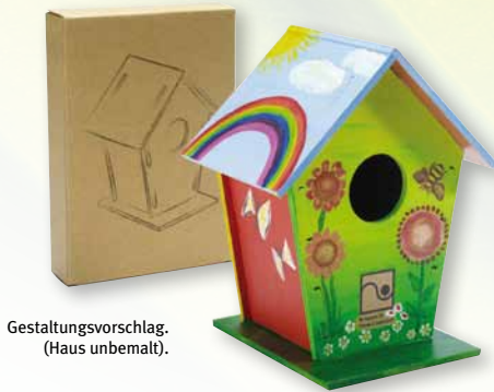
Gestaltungsvorschlag. (Haus unbemalt).