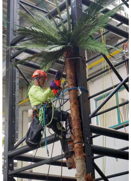
Baumpfleger gehen auf die Palme: Im Kletterforum hatten der Vortrag und die Vorführung zum Thema „Arbeiten mit Palmen“ viele interessierte Zuhörer. Die beiden Referenten waren aus Israel zu den Deutschen Baumpflegetagen gekommen.