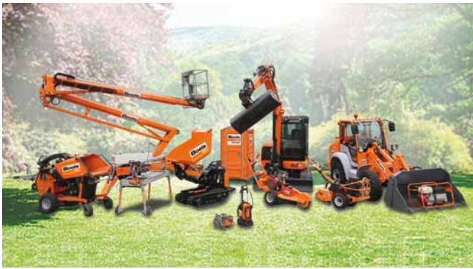
Boels bietet ein großes Maschinen- und Werkzeug-Sortiment für den GaLaBau an.