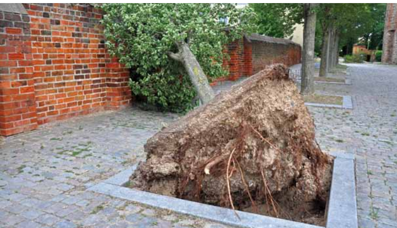
Der unterirdische Raumbedarf eines Straßenbaumes wird oft unterschätzt.

öffentliche Auftraggeber die VOB anwenden muss. Die Besonderheiten von Bauleistungen waren bisher in der VOB ausführlicher behandelt und geregelt als im BGB. Zum 1. Januar 2018 wurde jedoch das bisher im Bürgerlichen Gesetzbuch (BGB) sehr allgemein gehaltene Werksvertragsrecht reformiert. Im Bereich der öffentlichen Auftraggeber liegt weiterhin die VOB/B zu Grunde. Für private Auftraggeber bestehen jedoch nun wesentlich mehr gesetzliche Regelungen.