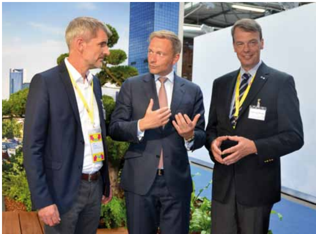
Auch FDP-Chef Christian Lindner kennt den Garten- und Landschaftsbau gut und weiß um die Bedeutung des Mittelstandes für die deutsche Wirtschaft.