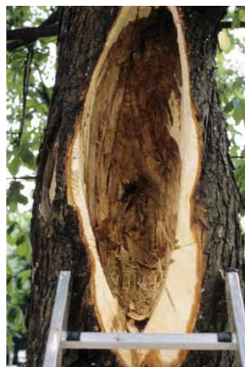
Das Verfüllen von Hohlräumen bei Bäumen war Teil der Baumchirurgie.