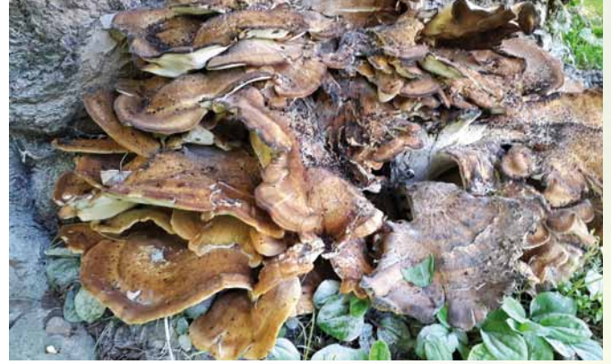
Holzzeretzende Baumpilze können ihren Wirt stark schädigen.