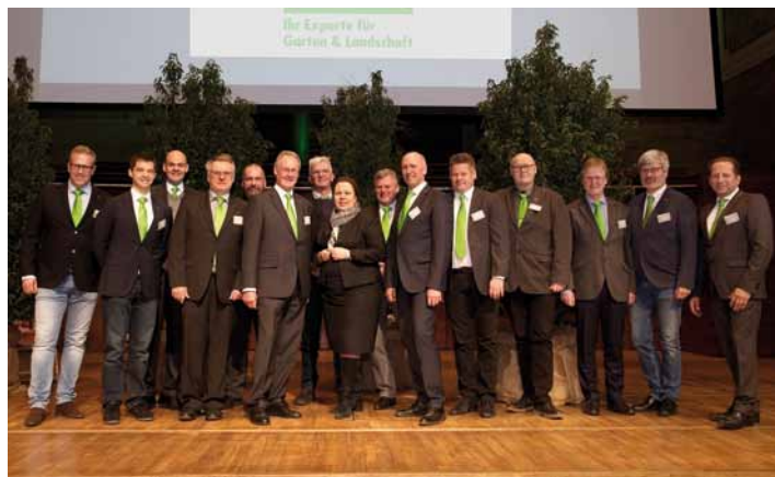
NRW-Umweltministerin Ursula Heinen-Esser stellte sich gemeinsam mit dem VGL-Präsidium den Fotografen.

In vier Themenforen konnten sich die Gäste dann mit Fragen rund um Ausbildung, Fort- und Weiterbildung sowie Personalentwicklung und Imagewerbung austauschen. Zur Seite standen ihnen dabei jeweils ein Referent des VGL NRW