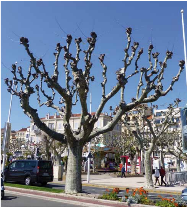
Der Kopfbau als besondere Form der Gestaltung ist jetzt Bestandteil der ZTV.