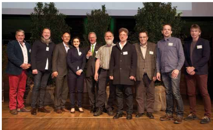
Im Rahmen der Mitgliederversammlung wurden 16 Betriebe für ihre 25-jährige Verbandsmitgliedschaft geehrt, neun Betriebe sind bereits seit 50 Jahren Mitglied im Verband.