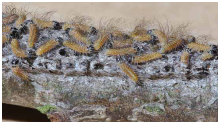
Die Brennhaare der Eichenprozessionsspinner-Raupe lösen bei Berührungen stets neue toxische Reaktionen aus. Sie halten sich auch an den Kleidern und Schuhen und dringen leicht in die Haut und Schleimhaut ein.

Landschaftsgärtner, im Gegensatz zum Schädlingsbekämpfer, über umfangreiche vegetationstechnische Kenntnisse. Dieses Know-how ist besonders für die Einordnung der Biologie des Schädlings und dessen Bekämpfung in Wechselwirkung mit der Gesunderhaltung der Eichen von besonderer Bedeutung“, so Jungjohann.