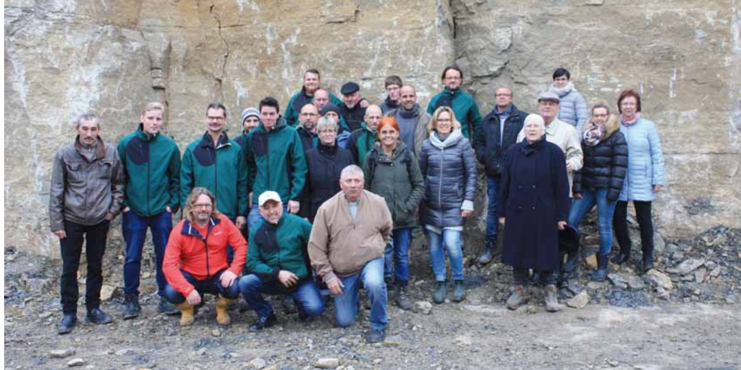
Seit 50 Jahren baut die Lindenlaub GmbH mit Stammsitz in Murr Gärten und Außenanlagen.