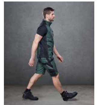
Die aktuelle Premiumkollektion der DBL umfasst auch funktionale Shorts und leichte Westen.

Wenn die Temperaturen steigen, ist luftige Kleidung gewünscht. Das gilt auch für die Profis im Garten und Landschaftsbau. Die DBL hat passende Lösungen. Der Auftritt sollte stimmen. Auch wenn es draußen wieder heiß ist. Für anspruchsvolle GaLaBau-Profis bietet die Kollektion DBL Meisterstück die passenden sommerlichen Artikel. Denn die aktuelle Premiumkollektion – exklusiv im Mietservice der DBL – überzeugt auch mit funktionalen Shorts und leichten Westen. Qualitativ hochwertig, auffällig designt – die Kollektionsteile für warme Tage entsprechen den hohen Ansprüchen des DBL Meisterstücks und verschaffen in der Farbstellung Opal/Grün, dazu für GaLaBau-Verbandsmitglieder inklusive Verbandseblem, ein imagegerechtes Erscheinungsbild. Ergänzen lässt sich das Meisterstück zudem durch hautfreundliche Basics wie T-Shirts, Polos oder kurzärmelige Hemden. Alles im gewohnt zuverlässigen Mietservice der DBL. Beschaffung, Organisation und fachgerechte Pflege leicht gemacht.