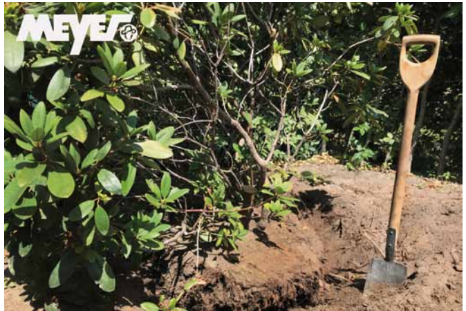
Ihr 200-jähriges Firmenjubiläum feiert die Hermann Meyer KG in diesem Jahr – der Grabespaten ist nach wie vor ein Klassiker im Angebot.