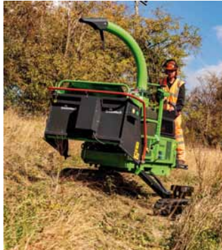
Bequem am Hang arbeiten, das geht dank individuell ausfahrbarer Raupen.

Nicht aus dem Gleichgewicht zu bringen ist der Safe-Trak 19-28. Den meistverkauften Raupenhäcksler Europas gibt es nun mit dem neuen, Sure-Trak-System – für noch mehr Agilität und Standsicherheit im Gelände. Mit zwei voneinander unabhängig steuerbaren, selbst nivellierenden und einzeln schwenkbaren Kettenschiffen meistert der Sure-Trak 19-28 jetzt noch unwegsameres Gelände. Überzeugt zeigt sich bereits die Fachjury der Demopark, die die Neuheit mit der Silbermedaille 2019 honorierte. Der 4-Zylinder-Motor von Kubota bringt mit 37 kW die nötige Power für den 2-Tonner auf und positioniert den Häcksler auf Hanglagen mit bis zu 35° Seitenneigung. Dabei bleibt er stets optimal mit Öl- und Kraftstoff versorgt. Bei besonders steilem Gelände kann der Bediener die Maschine um zusätzliche 15° korrigieren: Die doppelten Hydraulikzylinder regeln die Kettenschiffe und garantieren dem Sure-Trak 19-28 eine höhere Standfestigkeit. Der Maschinenführer hält dabei ganz locker die Balance: Schließlich liegt der Kippwinkel bei unerreichten 62°.