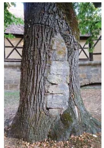
Das großzügige Ausschneiden von Wundrändern wurde lange praktiziert.