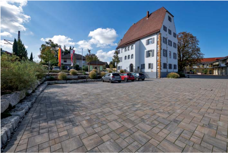
Das Castell in Eschbach beherbergt nun das Rathaus. Das historische Gebäude blickt auf eine lange Geschichte zurück.