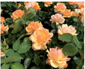
Sorte Hansestadt Rostock