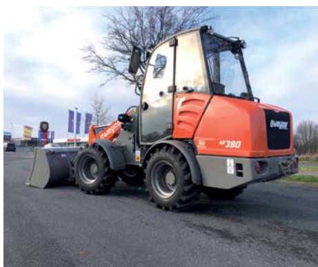
Ein kraftvoller und robuster Radlader für den GaLaBau

Atlas Weyhausen verwendet in seinen weycor Radladern fast ausschließlich robuste, wartungsarme Knickpendelgelenke in Verbindung mit Starrachsen. Diese sorgen mit einer Pendelung von \pm 12^\circ im Hinterwagen und einem beidseitigen Knickwinkel von 40^\circ für hervorragende Geländegängigkeit, bodenschonendes Fahren und extreme Wendigkeit. Durch den tief liegenden Schwerpunkt haben weycor Radlader auch unter extremen Bedingungen eine hohe Kippstabilität. Und da stellt sich der neue AR 380 in die Produktreihe stabil hin.