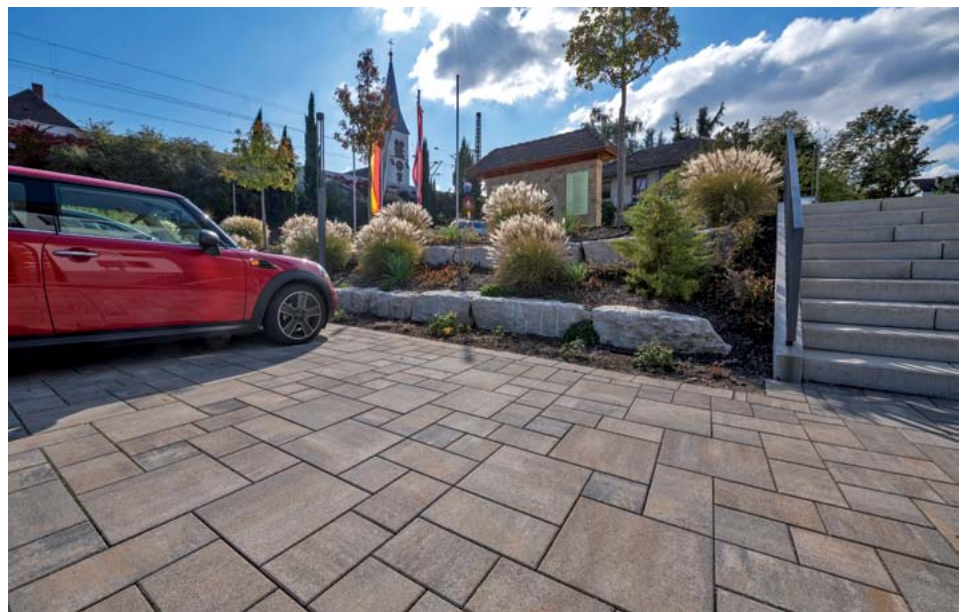
MultiTec-Color setzt die gesamte Fläche rund um das Rathaus in Szene. Die Farbgebung wurde objektspezifisch bei KANN gefertigt.