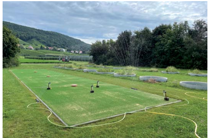
Versuch zur rohrlosen Entwässerung von Sportanlagen, LfULG, Dresden-Pillnitz

Es gibt viele kleine Stellschrauben zur Regenwassernutzung, an denen man drehen kann. Herstellerfirmen sind hier ebenso gefordert wie Landschaftsgärtnerinnen und -gärtner oder Planende. Städte, Bauherrinnen und -herren werden sich daran gewöhnen müssen, dass man Wasser auf Dächern hält, statt es abzuleiten. Die Techniken zur Regenwassernutzung sind an vielen Stellen schon sehr ausgereift. Bei Sportstätten oder Einfamilienhäusern kann Regenwasser beispielsweise in Zisternen gesammelt und anschließend für die Gartenbewässerung, im Hausbereich für die Toilettenspülung oder zum Wäschewaschen genutzt werden. Da gibt es entsprechende Regelwerke.