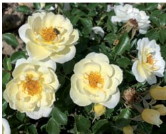
Sorte Bienenweide Ivory

E in kleines Blütenmeer gibt einen Vorgeschmack auf das, was die Bundesgartenschau im kommenden Jahr bieten wird: Insgesamt 4.440 Rosen stehen auf Spinelli, einem der beiden Schauplätze der BUGA Mannheim 2023, auf einer Fläche von etwa 1.400 Quadratmetern. Es sind 206 verschiedene Sorten von ganz unterschiedlichem Wuchs: Strauch und Kleinstrauchrosen, Beet- und Zwergrosen sowie Edel- und Wildrosen. Gepflanzt wurden sie im vergangenen Herbst, schon jetzt geben die Gehölze ein überzeugendes Bild ab. Die Rosen, von insgesamt 13 Ausstellern geliefert, sind Teil des gärtnerischen Wettbewerbs. Kürzlich wurden sie bereits zum ersten Mal von den Preisrichtern und -richterinnen begutachtet.