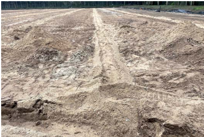
Einbau einer rohrlosen Entwässerung, Sportanlage Hamburg-Kroonhorst