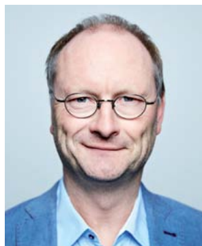
Sven Plöger, Meteorologe und Moderator (GaLaBau WELCOME)