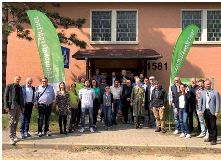
Alle Mitgliedsbetriebe, die einen Schaugarten auf der BUGA Mannheim bauen.

Der Grundausbau für die Gärten beginnt im Juli/August. Die Umsetzung der einzelnen Schaugärten durch die Mitgliedsbetriebe ist dann ab September 2022 geplant.