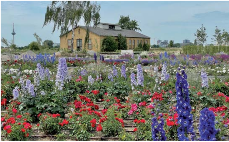
Rittersporn ergänzt die Rosen auf dem „Experimentierfeld“ auf Spinelli. Die historische Heizzentrale im Hintergrund wird Sitz des Bildungszentrums i-Punkt GRÜN sein.