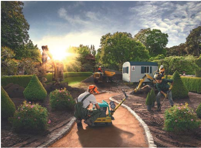
Bei HKL BAUMASCHINEN finden Kunden nützliche Geräte und kompakte Maschinen für jeden Anwendungsbereich im GaLaBau.