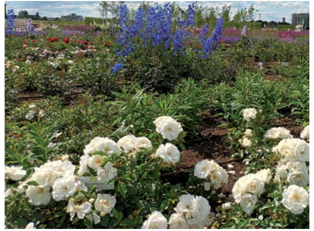
Die weiße Sorte „Schneeflocke“ vor blauem Rittersporn. Im kommenden Jahr werden die Pflanzen weiter eingewachsen sein.