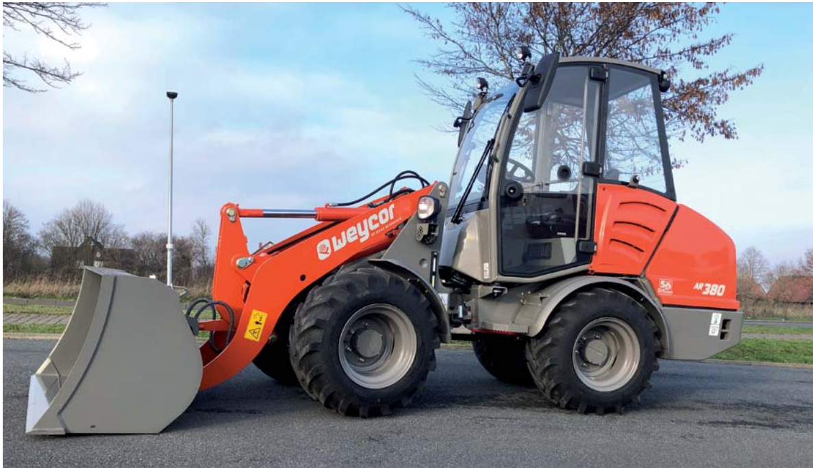
Der neue AR 380 von Atlas Weyhausen

ATLAS WEYHAUSEN BRINGT NEUEN RADLADER FÜR DEN GALABAU