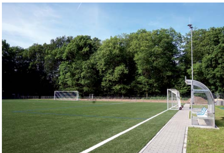
Sportanlage Nachtflügelweg in Dresden: Niederschlagswasser wird gesammelt und zur Beregnung eines Rasenplatzes verwendet