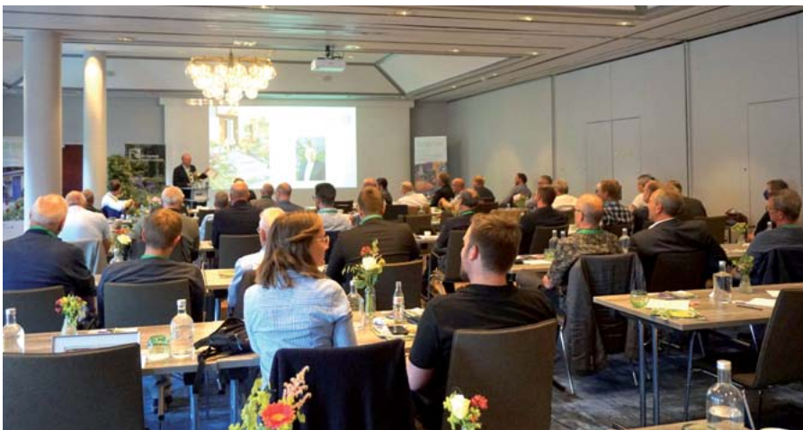
Zur diesjährigen Mitgliederversammlung des FGL S.-H. kamen Mitglieder und externe Gäste im Hotel Steigenberger Conti Hansa in Kiel zusammen.