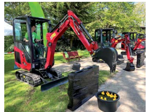
Vier Yanmar SV15 VT unterstützten den bundesweit größten Azubiwettbewerb im GaLaBau.

Beim deutschlandweit größten Berufswettbewerb für den Garten- und Landschaftsbau im Westfalenpark Dortmund haben Auszubildende aus ganz Nordrhein-Westfalen am 6. und 7. Mai 2022 an verschiedenen Stationen ihr Fachwissen und Können bewiesen. Der Yanmar-Händler Tecklenborg GmbH & Co. KG (Tecklenborg) aus Werne ist traditionell Sponsor der Veranstaltung und stellte für den Baggerwettbewerb die richtigen Maschinen bereit: vier Yanmar-Minibagger des Typs SV15 VT , alle bereits im neuen Yanmar-Farbtou „Premium-Rot“ lackiert.