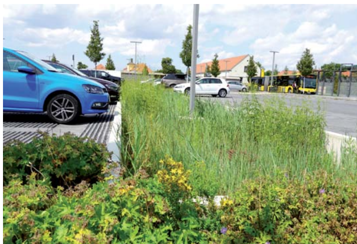
Tiefbeet auf dem Schlossparkplatz Dresden-Pillnitz