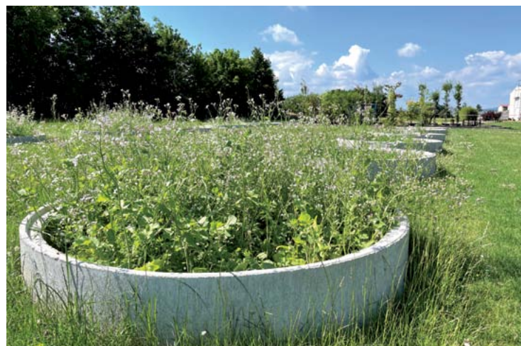
Versuch zum Zusammenhang von Dachwurzeln und Sickerrate, LfULG Dresden-Pillnitz

Pflegemaßnahmen wirklich nötig sind. Die wassersensible Planung bezieht sich nicht nur auf den Umgang mit Wasser, sondern auch auf die Unterhaltung und Pflege von Pflanzen und Grünanlagen. Gerade Kommunen sollten mutig vorgehen und Neues wagen. Denn sie haben eine Vorreiterstellung.