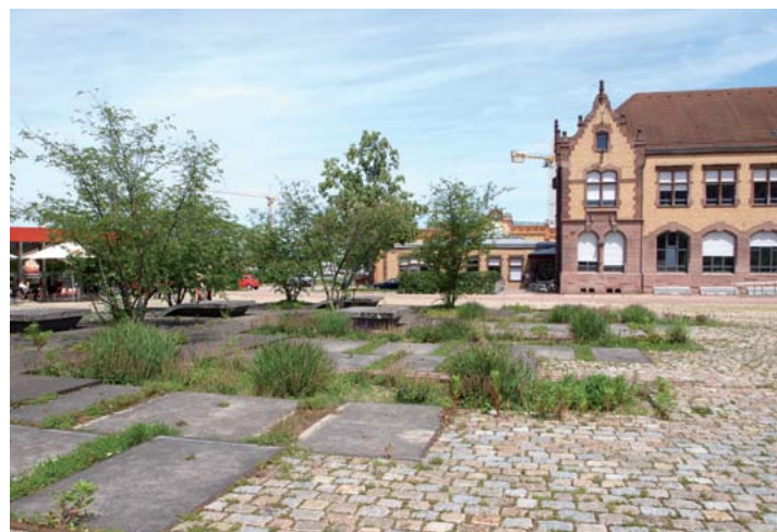
Versickerungsmulden auf dem Zollhallenplatz Freiburg

Der erste Schritt für Landschaftsgärtnerinnen und -gärtner sollte darin bestehen, Bauherrinnen und -herren für dieses Thema zu begeistern. Wer Pflanzen liebt, ist bereits sensibilisiert, denn man sieht ja, was der eigene Garten braucht. Alle reden derzeit von Regenwasserbewirtschaftung. Wir müssen die Notwendigkeit gar nicht mehr begründen. GaLaBau-Betriebe können Bauherrinnen und -herren daher leichter die Vorteile eines sinnvollen Umgangs mit Wasser nahebringen, damit Gärten und Parkanlagen grün bleiben.