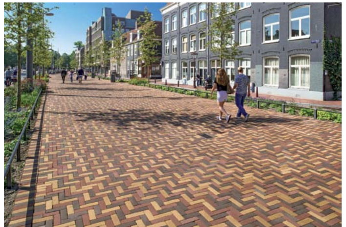
Klinkerpflaster sind das Gegenteil von langweilig. Zum Beispiel: Drei unterschiedliche Farbvarianten, im Ellenbogenverband auf einem Fußgängerboulevard verlegt.